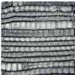
black perlato argento 3