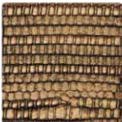
dk brown perlato oro 7