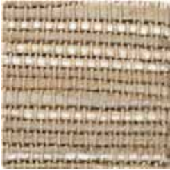
ivory perlato oro bianco 1