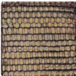
dk brown perlato oro bianco 4