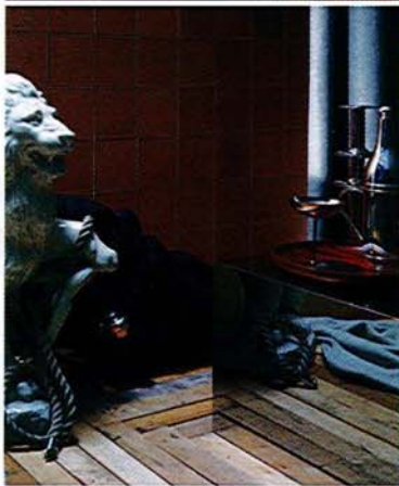
Leather wall coverings from the Studioart Leatherwall catalogue. Rivestimenti di pelle per pareti dal catalogo Leatherwall di Studioart