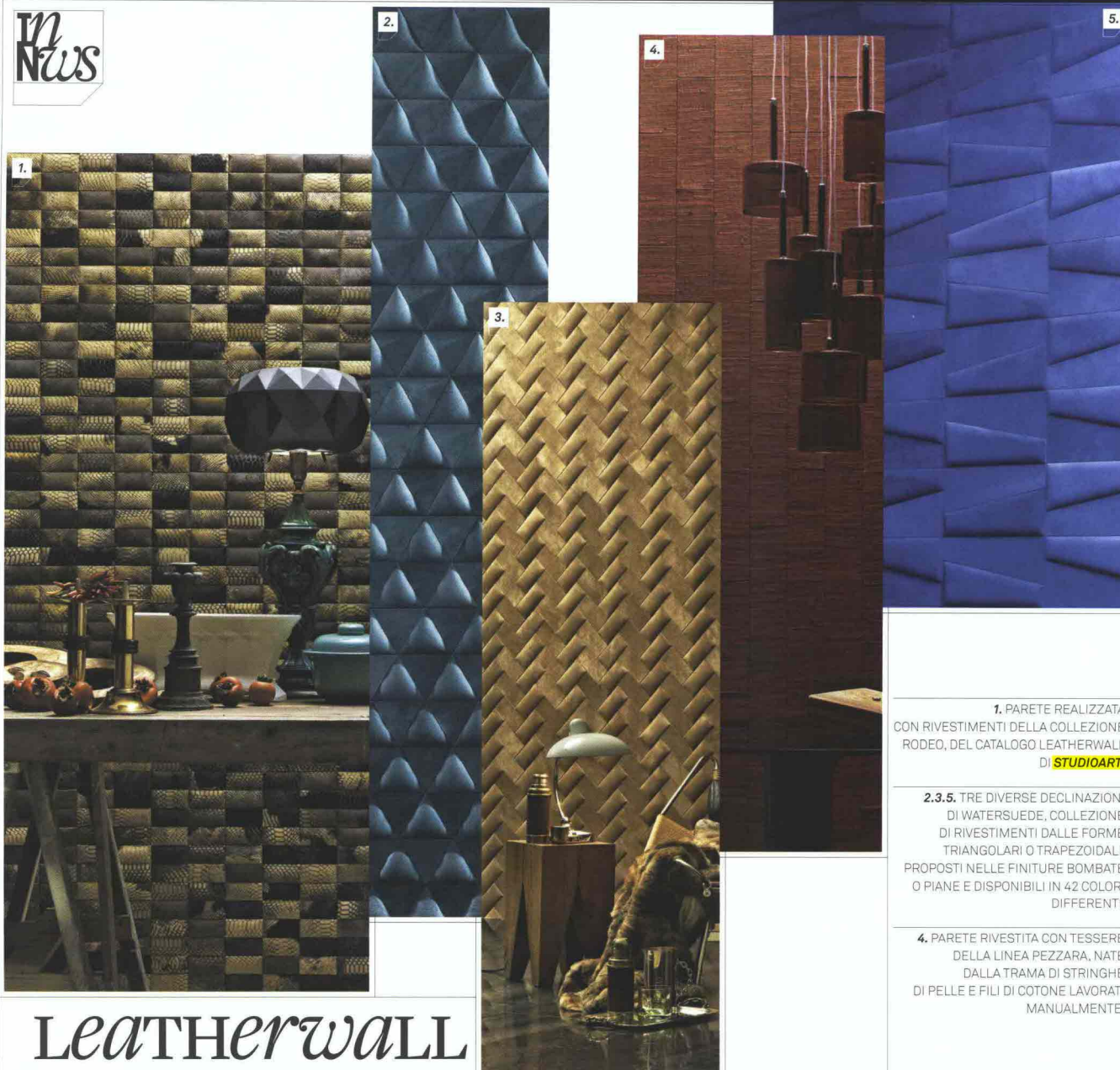
1. PARETE REALIZZATA CON RIVESTIMENTI DELLA COLLEZIONE RODEO, DEL CATALOGO LEATHERWALL DI STUDIOART