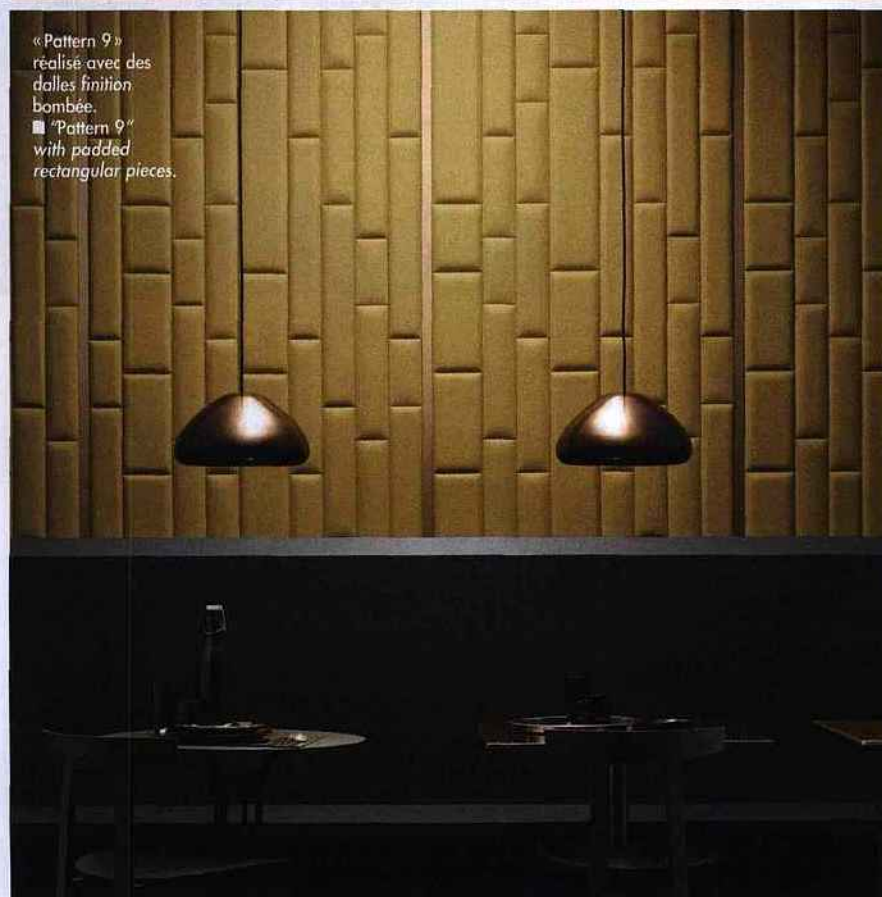
« Pattern 9 » réalisé avec des dalles finition bombée. ■ « Pattern 9 » with padded rectangular pieces.

France, Belgique/France, Belgium: Chez Rubelli, france@rubelli.com Contact International : paola@studioart.it INTERNET www.studioart.it