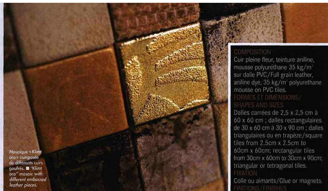
Mosaïque « Klimt oro » composée de différents cuirs gaufrés. ■ « Klimt oro » mosaic with different embossed leather pieces.