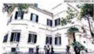
Luiss. Il palazzo acquistato dal gruppo Toti per 117 milioni