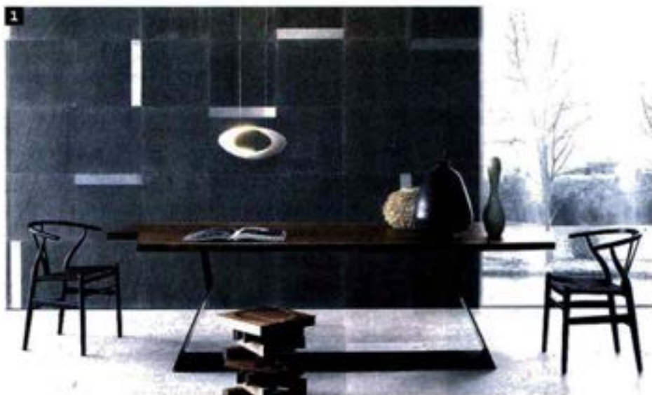
1. Neutra, Augmented Texture, design Elia Nedkov (da 200 euro al mq). 2. Mutina, collezione Tex, design Row Edges (da 218 euro al mq). 3. Xilo1934, collezione 1934Design. Parquet con decoro di Luca Scacchetti (da 47 euro al pezzo/doga). 4. Ceramica Sant'Agostino, Flexible Architecture, design Philippe Starck. In produzione da aprile. 5. Lithos Design, serie Drappi di Pietra, design Raffaello Galotto (da 1.512 euro al mq)