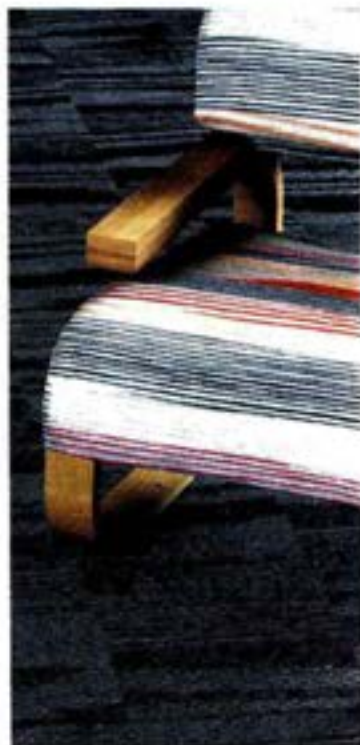
Variopinta. Bolon, Bolon by Missoni, Flame Black (da 165 euro al mq)