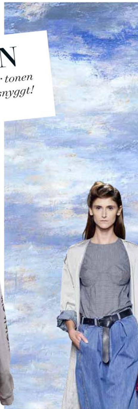
DRIES VAN NOTEN

Tapet, 294 kr/kvm, Photowall. Taktampa av handgjord cellulosa, från 2320 kr, Indi.