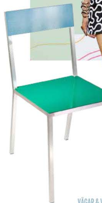
VÅGAR & VATTEN

Tapet med valfri kartbild, 295 kr/kvm, Rebel walls. Stol av aluminium, 8300 kr, Muller Van Severen.