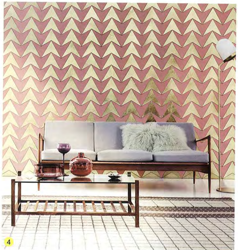
4.Vector，透過新的形狀和技術再現自然界的重複圖案，Elaine Yan Ling Ng設計。 5/6.Hyperreal，設計元素一致，拼砌效果卻截然不同，Elaine Yan Ling Ng設計。

The Fabric Lab的創辦人Elaine Yan Ling Ng(吳燕玲)表示，「自然拓撲」(Natural Topology)是其系列的概念指引。拓撲來自希臘的慣用語、地點和標識，說的是對空間及其互連的研究。她從自然界物種的巧妙繁衍及緊湊編排為靈感，設計出發點是將室外的自然形狀引入室內為目的，藉體積、觸感和幻想營造身歷其境的體驗。她細看自然界中的重複圖案，透過新的形狀和技術再現，創作出以自然為題、與數學和計算有關連的系列。MI