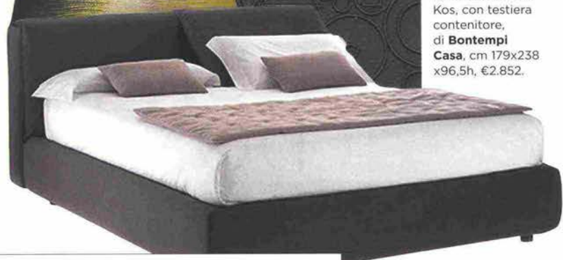
Letto sfoderabile Kos, con testiera contenitore, di Bontempi Casa , cm 179x238x96,5h, €2.852.