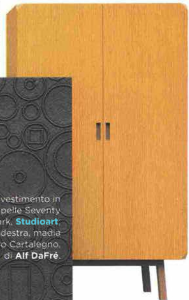
Rivestimento in pelle Seventy Dark, Studioart ; a destra, madia retro Cartalegno, di Alf DaFré .