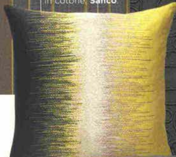
Misto cotone Repeat Classic, di Hella Jongerius, Maharam ; sotto, Cosima Cushion, in cotone, Sahco .