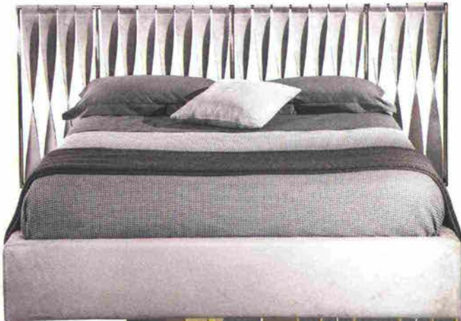
Letto Twist, in metallo tagliato al laser, con testiera in pelle intrecciata, Cantori , cm 281x115x85h, €2.900.