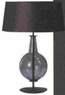
Sopra, lampada da tavolo New Classic, Penta ; sotto, scrittoio con ribalta Gentleman, Flou , da €14.185.