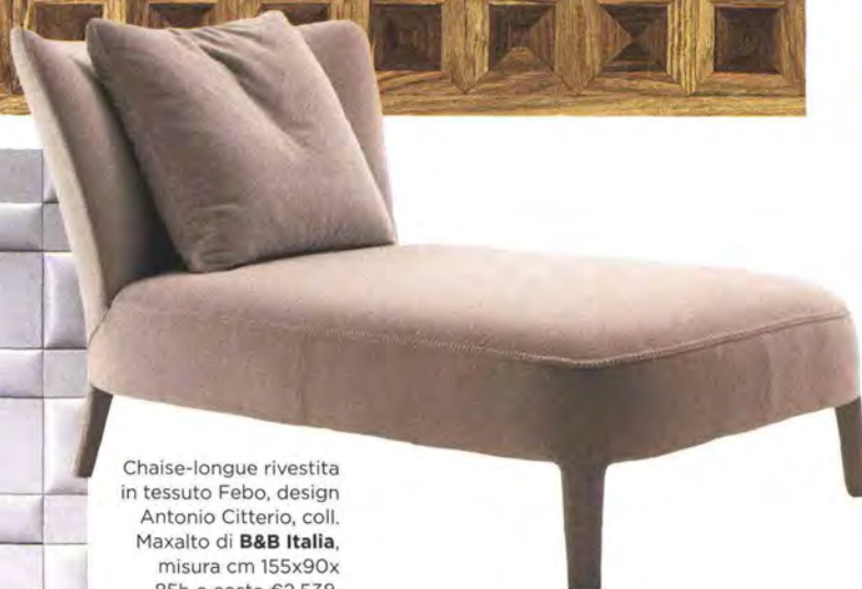
Chaise-longue rivestita in tessuto Febo, design Antonio Citterio, coll. Maxalto di B&B Italia , misura cm 155x90x85h e costa €2.538.