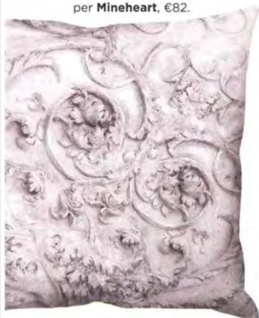
Ispirato ai decori del XVIII sec., cuscino in puro cotone Stone Heart Grey, design Young & Battaglia per Mineheart , €82.