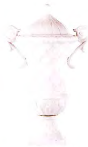
Vaso in ceramica, Gianfranco Ferré Home ; a sinistra, porta Antikè, qui nella finitura anticata, di Bertolotto Porte .