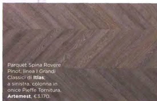
Parquet Spina Rovere Pinot, linea I Grandi Classici di Itlas ; a sinistra, colonna in onice Pieffe Tornitura, Artemest , €3.170.