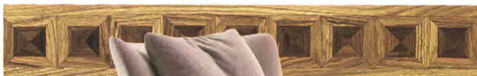
A destra, cornice décor per parquet Diamanti, in massello prefinito, di ALI Parquets ; sotto, rivestimento in pelle Pearl White, Studioart .