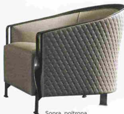
Sopra, poltrona matelassé Paris, con finiture bronzo, di Carlo Colombo per Rugiano ; in alto, sospensione Gioia con piccoli pendenti in vetro, Cantori .