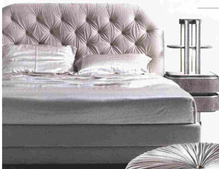
Sopra, letto in rovere G 1597 con due comodini integrati, Annibale Colombo ; a destra, pouf rivestito in pelle nabuk, Roberto Cavalli Home Interiors .