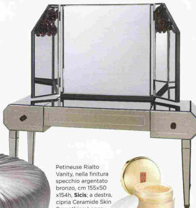
Petineuse Rialto Vanity, nella finitura specchio argentato bronzo, cm 155x50 x154h, Sicis ; a destra, cipria Ceramide Skin Smoothing Loose, Elizabeth Arden .