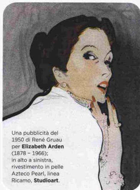
Una pubblicità del 1950 di René Gruau per Elizabeth Arden (1878 - 1966); in alto a sinistra, rivestimento in pelle Azteco Pearl, linea Ricamo, Studioart .